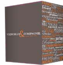
BIB avec affichette carton personnalisable