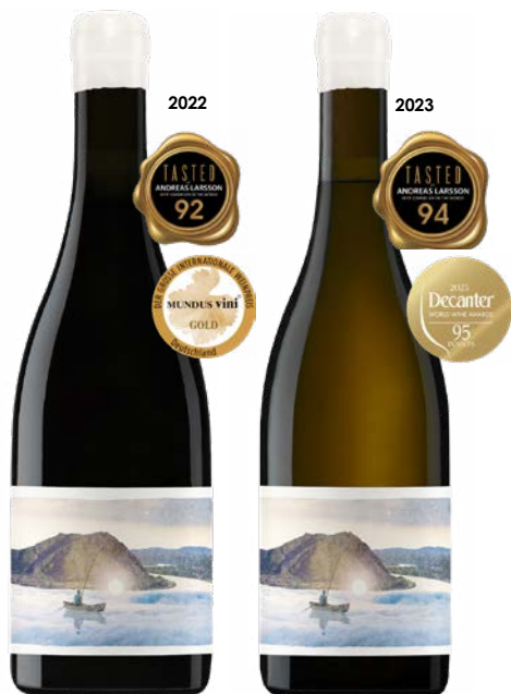
A CEUX QUI RÊVENT