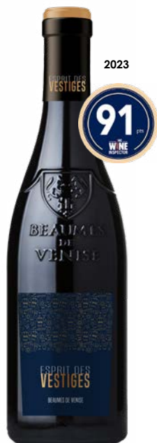
ESPRIT DES VESTIGES