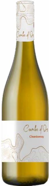
COMBE D'OR CHARDONNAY