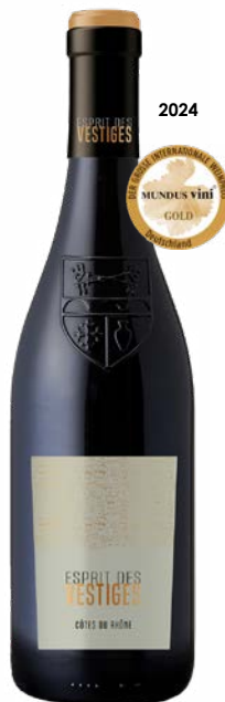
ESPRIT DES VESTIGES