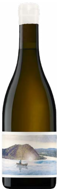
A CEUX QUI RÊVENT