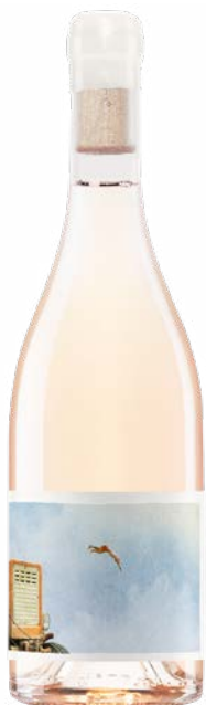
A CEUX QUI RÊVENT