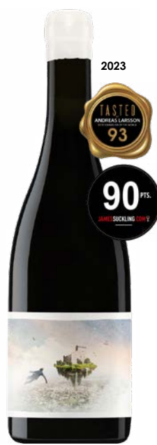
A CEUX QUI RÊVENT