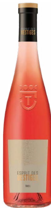
ESPRIT DES VESTIGES