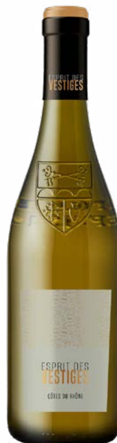
ESPRIT DES VESTIGES