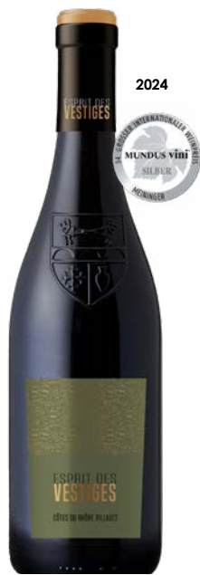
ESPRIT DES VESTIGES