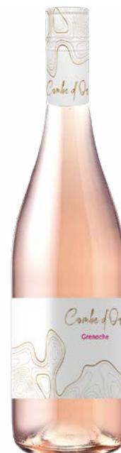
COMBE D'OR GRENACHE