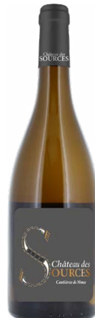
CHÂTEAU DES SOURCES CUVÉE S