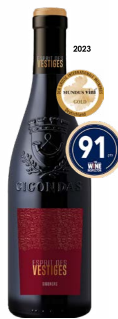
ESPRIT DES VESTIGES