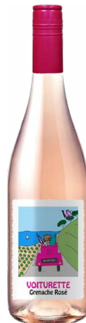
VOITURETTE GRENACHE ROSÉ