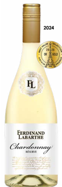
FERDINAND LABARTHE CHARDONNAY