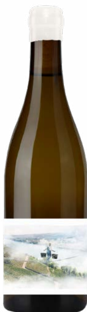
A CEUX QUI RÊVENT