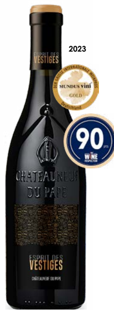
ESPRIT DES VESTIGES