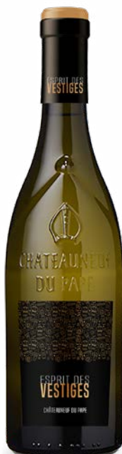
ESPRIT DES VESTIGES