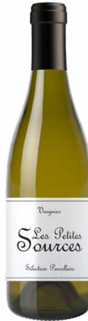
LES PETITES SOURCES