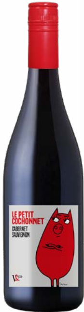
COCHONNET - CABERNET - SAUVIGNON