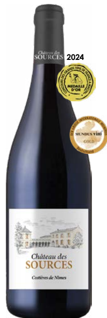
CHÂTEAU DES SOURCES