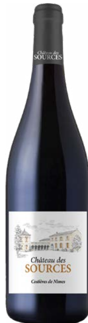
CHÂTEAU DES SOURCES