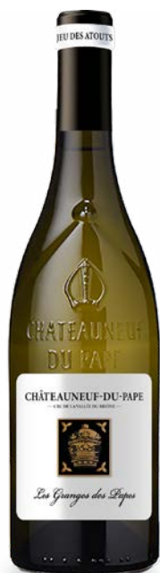
LES GRANGES DES PAPES