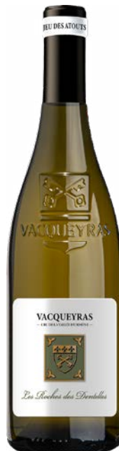
LES ROCHES DES DENTELLES