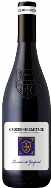
LA CROIX DE GASPARD