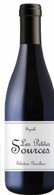
LES PETITES SOURCES