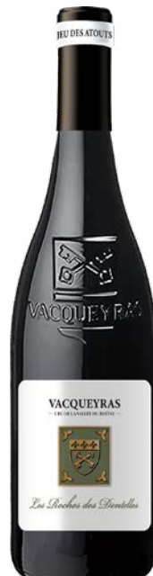
LES ROCHES DES DENTELLES