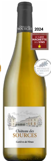
CHÂTEAU DES SOURCES