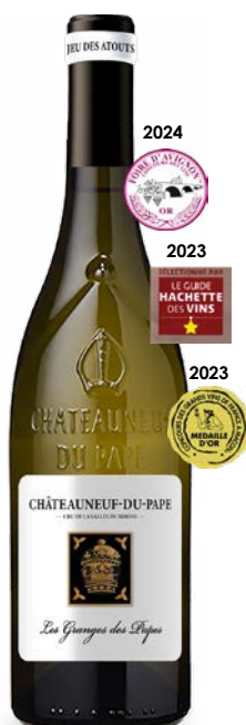
LES GRANGES DES PAPES