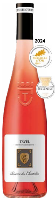
RESERVE DES CHASTELLES