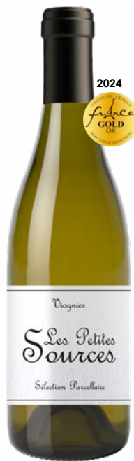
LES PETITES SOURCES