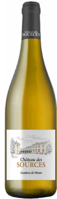
CHÂTEAU DES SOURCES