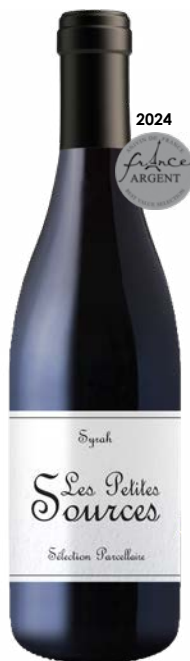
LES PETITES SOURCES