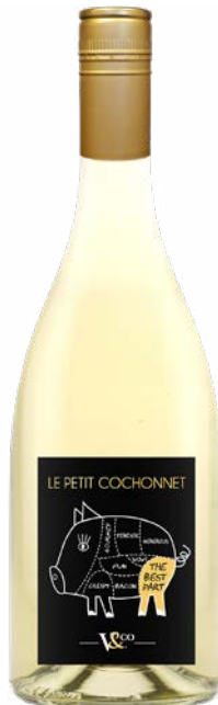
COCHONNET - THE BEST PART