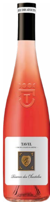
RÉSERVE DES CHASTELLES