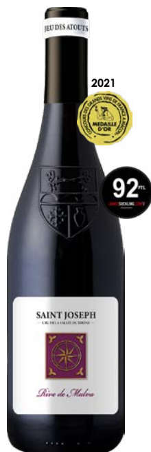
RIVE DE MALVA