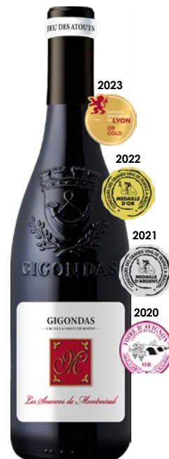
LES SOURCES DE MONTMIRAIL