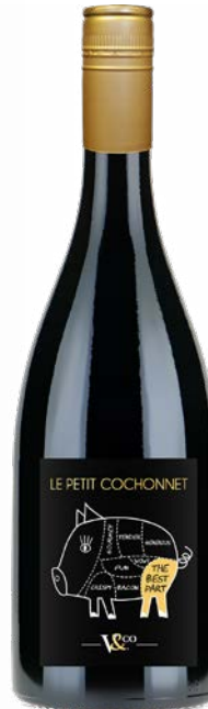
COCHONNET - THE BEST PART