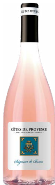
SEIGNEUR DE BOSON