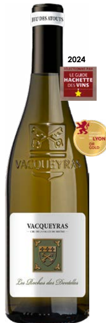
LES ROCHES DES DENTELLES