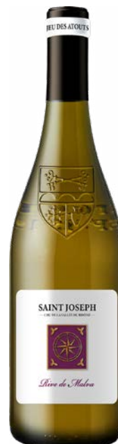
RIVE DE MALVA