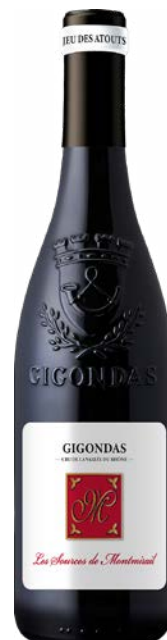
LES SOURCES DE MONTMIRAIL