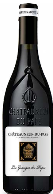
LES GRANGES DES PAPES