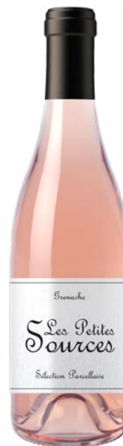
LES PETITES SOURCES