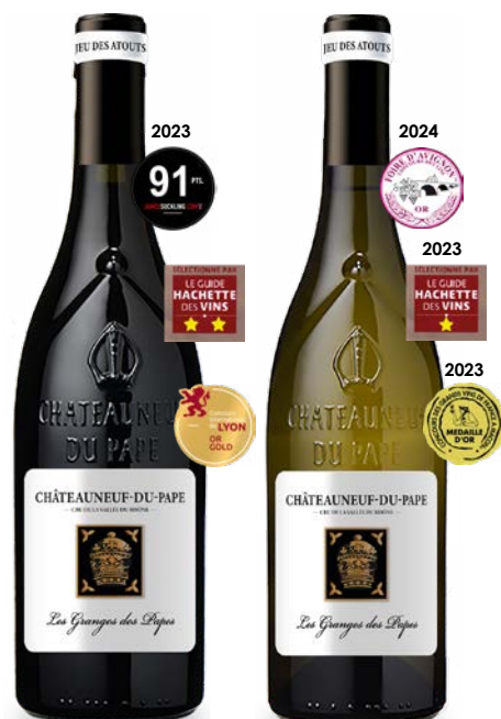
LES GRANGES DES PAPES