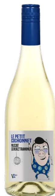
COCHONNET MUSCAT - GEWURZTRAMINER