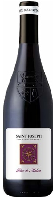
RIVE DE MALVA