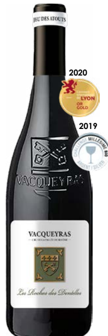
LES ROCHES DES DENTELLES