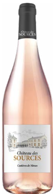
CHÂTEAU DES SOURCES